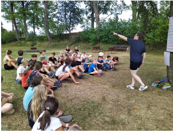
Adaptační kurz primánů