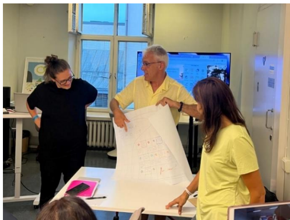
Vzdělávání pedagogů (Finsko)