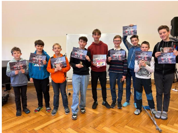
Vítězné týmy oblastního kola pišQworek