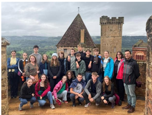
Výměnný pobyt ve Francii