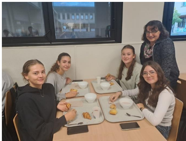
Výměnný pobyt ve Francii