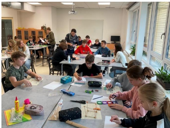
„Tělesa“ v sekundách