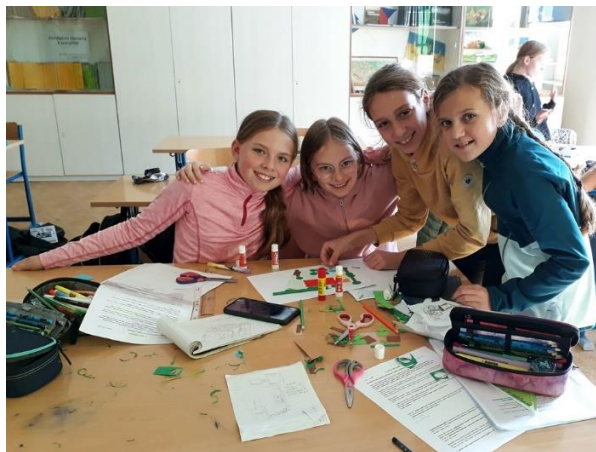
„Území a jeho využití“ v primách