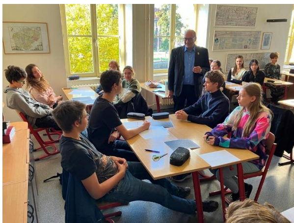
„Totalitní režimy“ v septimách