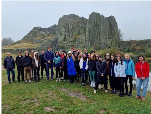
Zeměpisná exkurze do Českého středohoří