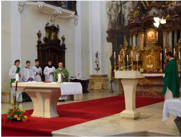
Mše svatá k zahájení školního roku