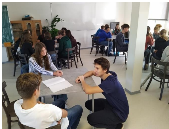
„Osobnost a dílo W. Shakespeara“ v kvartách