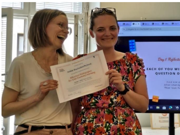
Vzdělávání pedagogů (Finsko)