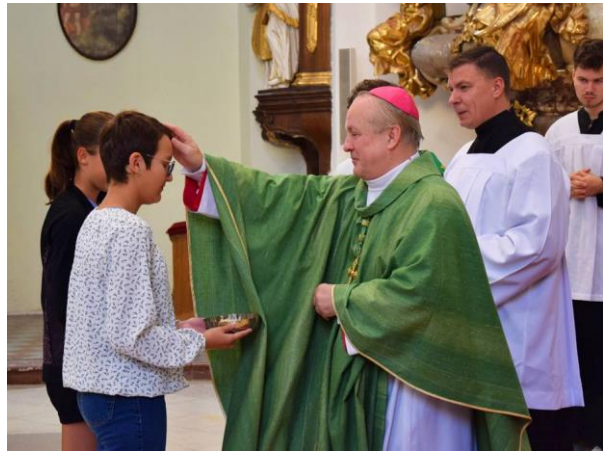
Mše svatá k zahájení školního roku