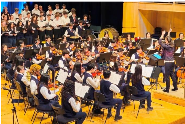
Společný česko-kanadský koncert