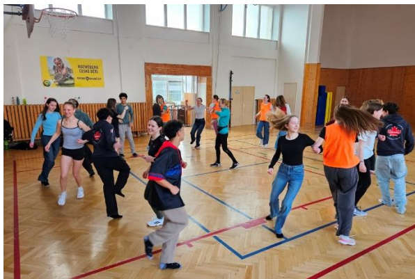
Návštěva kanadských studentů na BIGY