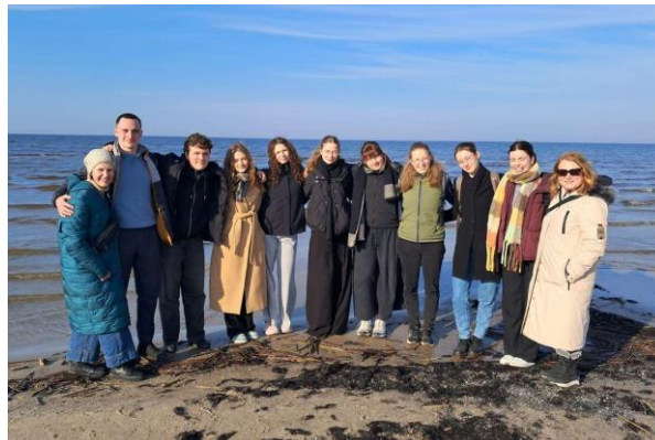
Výměnný pobyt v Lotyšsku