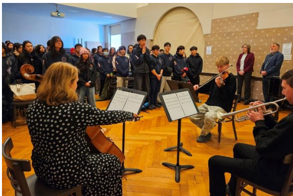
Přivítání kanadských studentů na BIGY