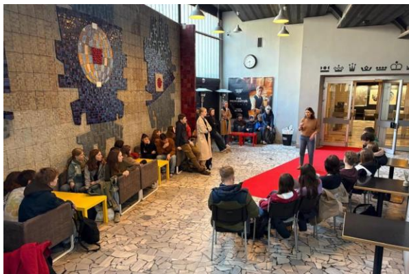
Program pro německé studenty v Hradci