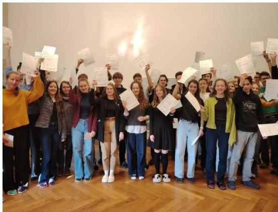
Předávání jazykových certifikátů