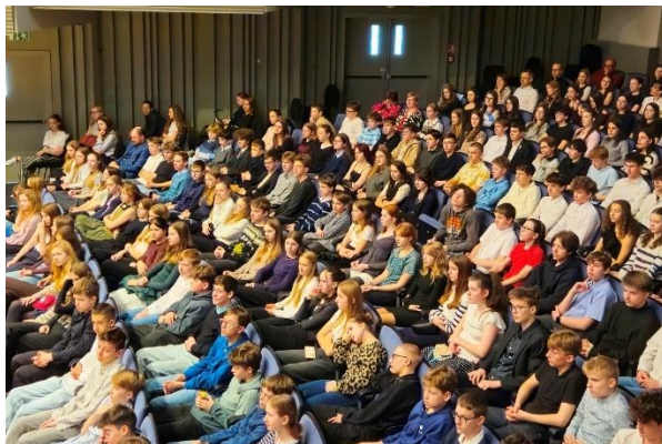
Společný česko-kanadský koncert