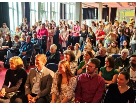
Vernisáž výstavy výtvarných prací