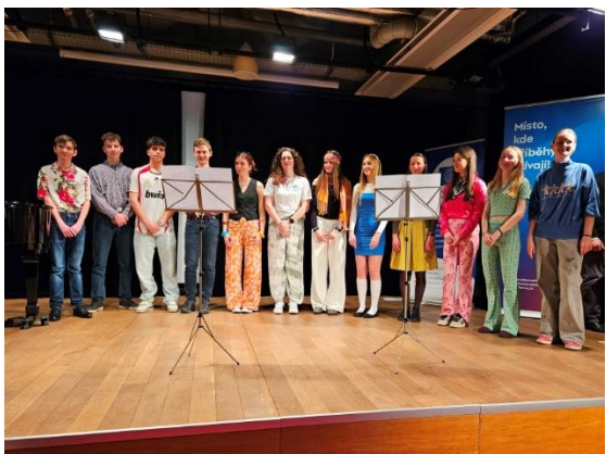
Vernisáž výstavy výtvarných prací