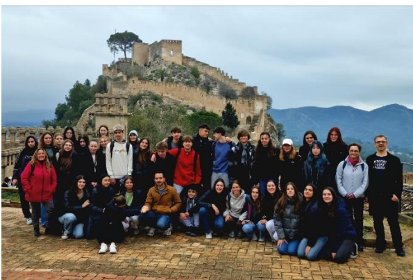
Skupinová výměna ve Španělsku