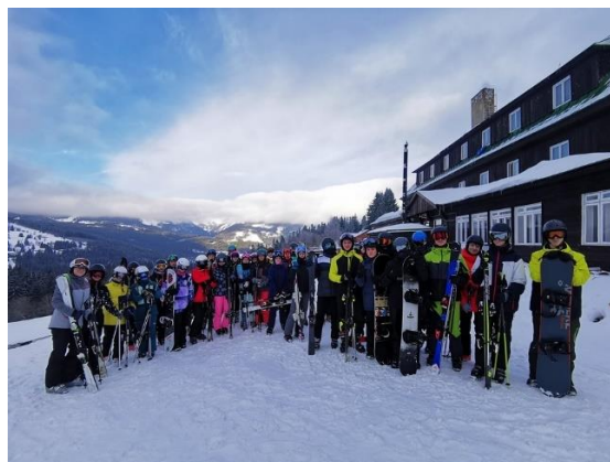
Lyžařský kurz kvint