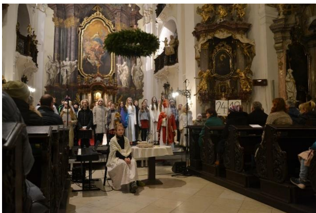
Adventní pásno prim