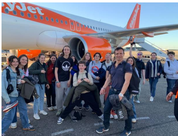
Návštěva z partnerské francouzské školy