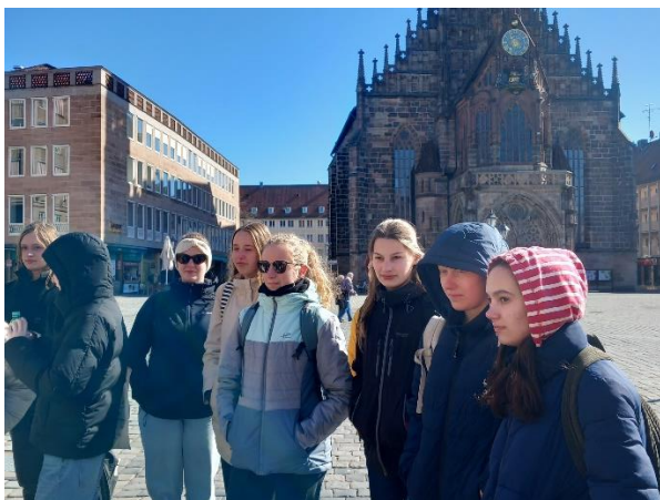
Skupinová výměna v Německu